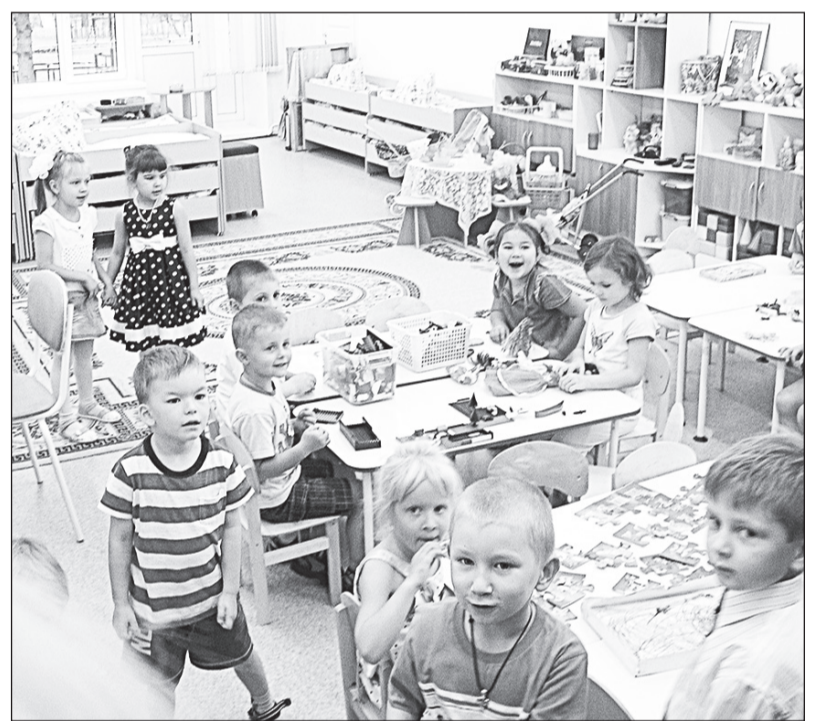
Ребяточки группы «Звездочка» очень довольны новым интерьером и игрушками!