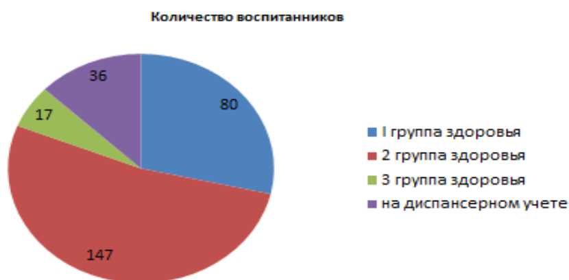
Диаграмма № 1. Распределение детей по группам здоровья

В 2016-2017 учебном году количество детей с первой группой здоровья – 80 человек (33%), со второй группой здоровья – 147 человек (60%), с третьей группой здоровья – 17 человек (7%), с четвертой группой – 1(0,4%) из общего количества детей, состоящих на диспансерном учете - 36 человек (15%). (Диаграмма № 1).